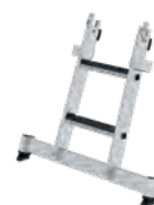
Abb. Bestell-Nr. 12014