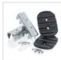
Sicherer Stand Outdoor Bestell-Nr. 19325

Unsere Sets machen den Arbeitsalltag nicht nur sicherer, sondern auch effizienter und komfortabler.