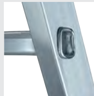
4-fach gebördelte Stufen-/Holmverbindung