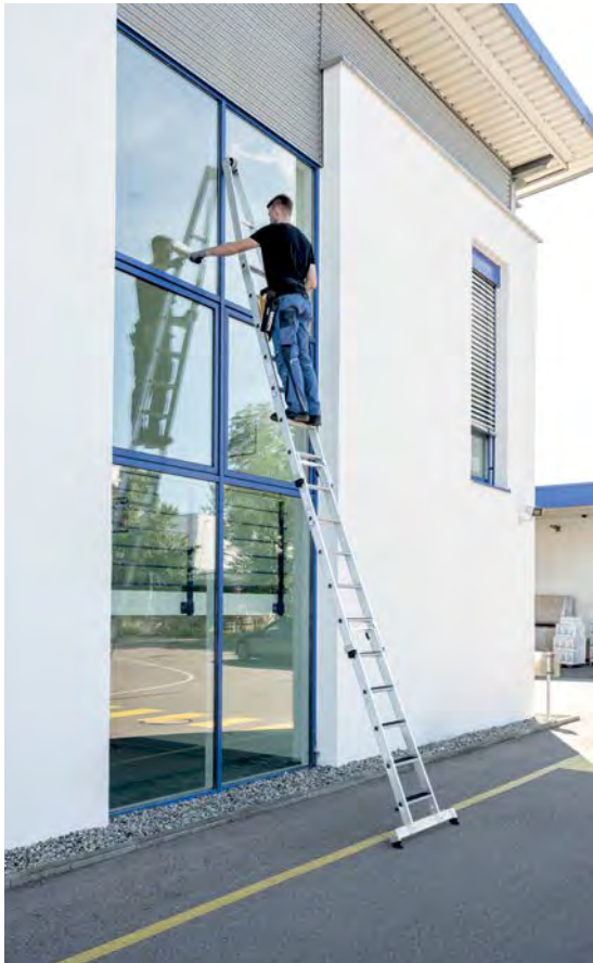
Abb. Bestell-Nr. 12011 mit Bestell-Nr. 12012 und Bestell-Nr. 12013