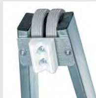
Anlegegummi mit Keilausschnitt