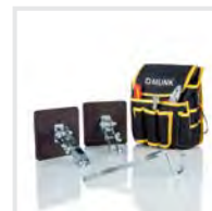
Praktische Helfer 2 Bestell-Nr. 19328