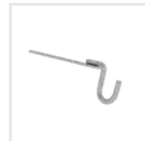
Eimerhaken Bestell-Nr. 19115